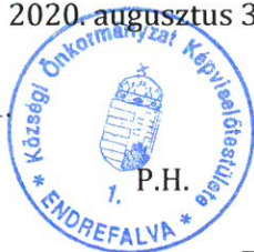
Csóriné Botyánszki Ágnes